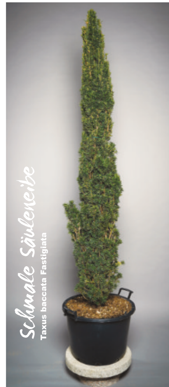
Diese Pflanze bringt einen gewissen Flair und Stil in Eingangsbereiche, an Hausauffahrten oder direkt im Garten.