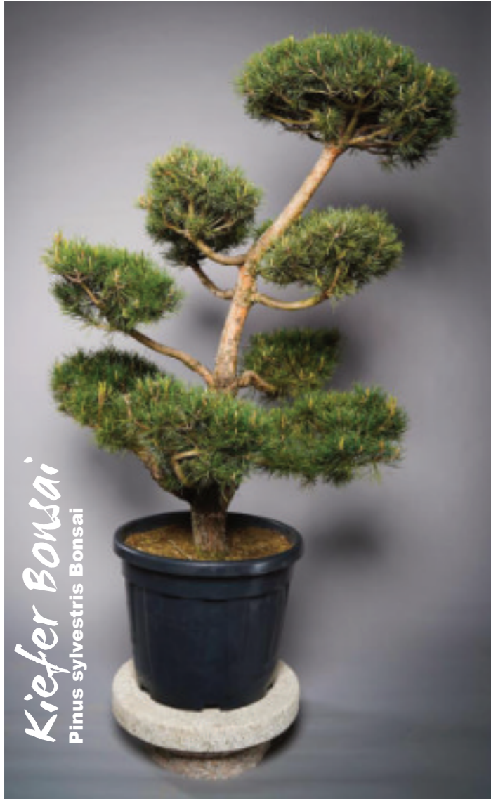
Kiefer Bonsai Pinus sylvestris Bonsai

Der schön wachsende Baum ist ein attraktiver Solitär, er zieht im Garten alle Blicke auf sich und verleiht als immergrüne Pflanze dem Grundstück im Winter Struktur.