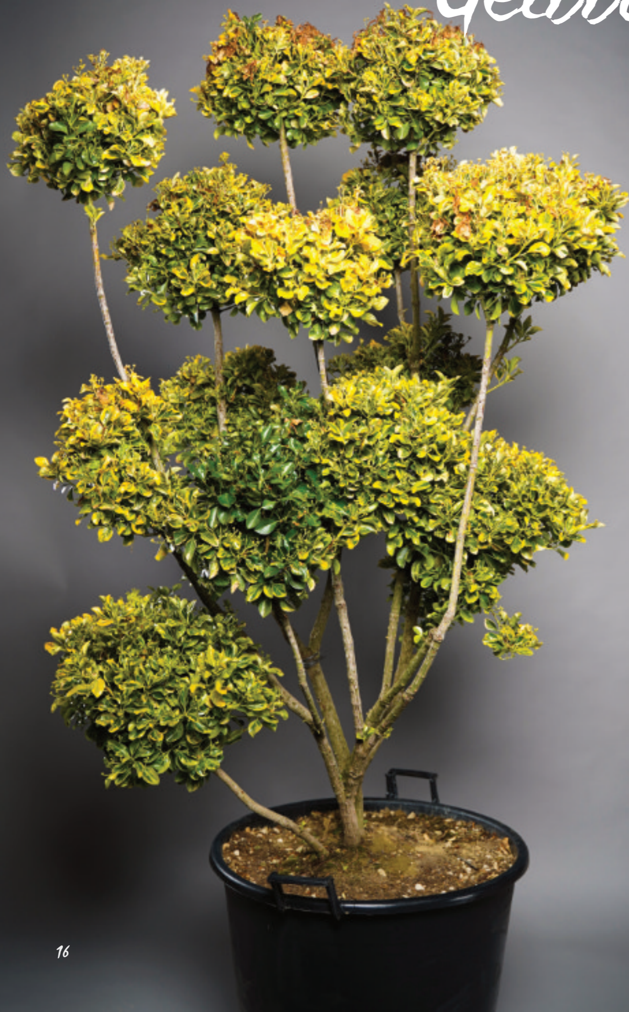
Eunonymus japonicus 'Elegantissima Aurea' Bonsai