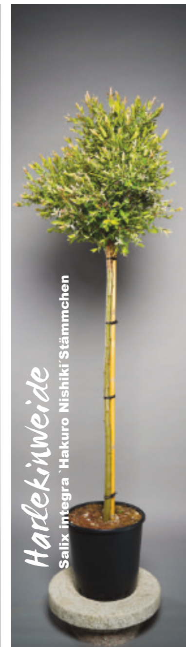
Ihre wunderschöne Laubfärbung vermittelt optisch den Eindruck einer überreichen Blütenpracht.