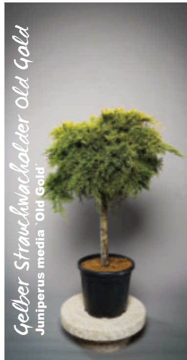
Gelber Strauchwacholder Old Gold Juniperus media 'Old Gold'

Seine Nadeln schimmern an den jungen Trieben goldgelb und später gelbgrün.