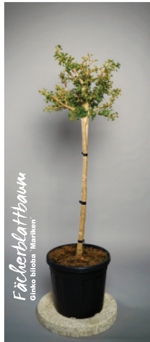
Der Fächerblattbaum / Ginkgobaum schmückt mit seinen ikonischen Blätter jeden Garten vortrefflich.