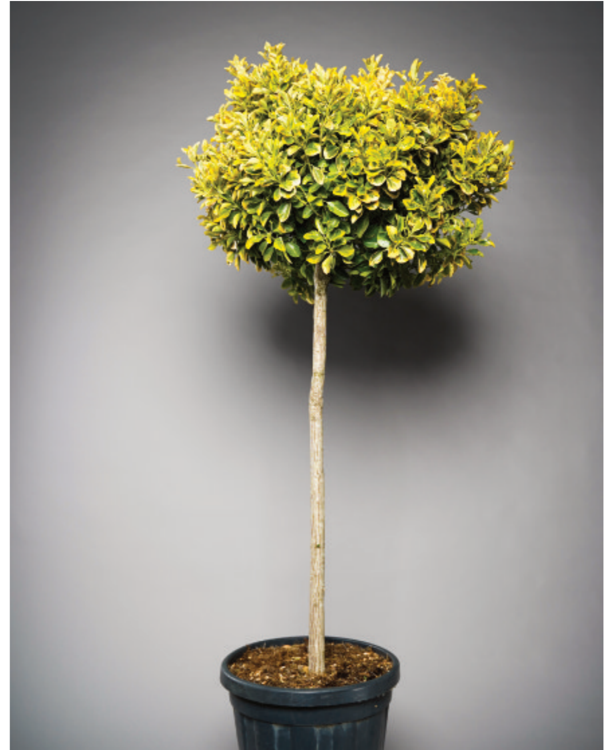
Eunonymus japonicus 'Elegantissima Aurea' Stämmchen

Die Japanspindel begeistert das ganze Jahr über mit seinem grün und gelb panaschierten Laub.