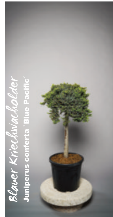
Blauer Kriechwacholder Juniperus conferta 'Blue Pacific'

Seine Blätter schimmern in einem sehr schönen blaugrau und seine Wuchsform ist extrem schmal mit senkrecht ansteigenden Ästen.