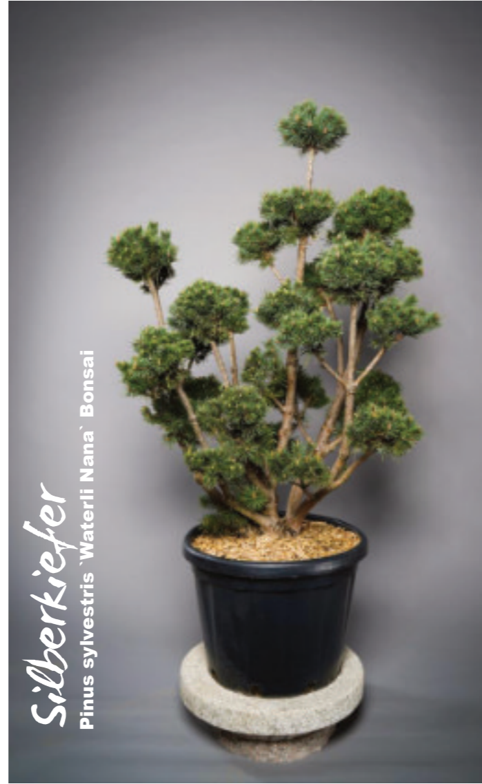
Silberkiefer Pinus sylvestris 'Waterli Nana' Bonsai

Der schön wachsende Baum ist ein attraktiver Solitär, er zieht im Garten alle Blicke auf sich und verleiht als immergrüne Pflanze dem Grundstück im Winter Struktur.