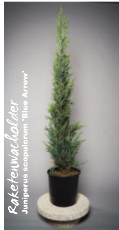
Raketenwacholder Juniperus scopulorum 'Blue Arrow'

Der Gelbe Wacholder ist eine immergrüne Konifere, die durch ihren ausgefallenen Wuchs überzeugt. Er ist ein Blickfang, denn das ganze Jahr ist er farbbeständig in Gold- bis Grüngelb.