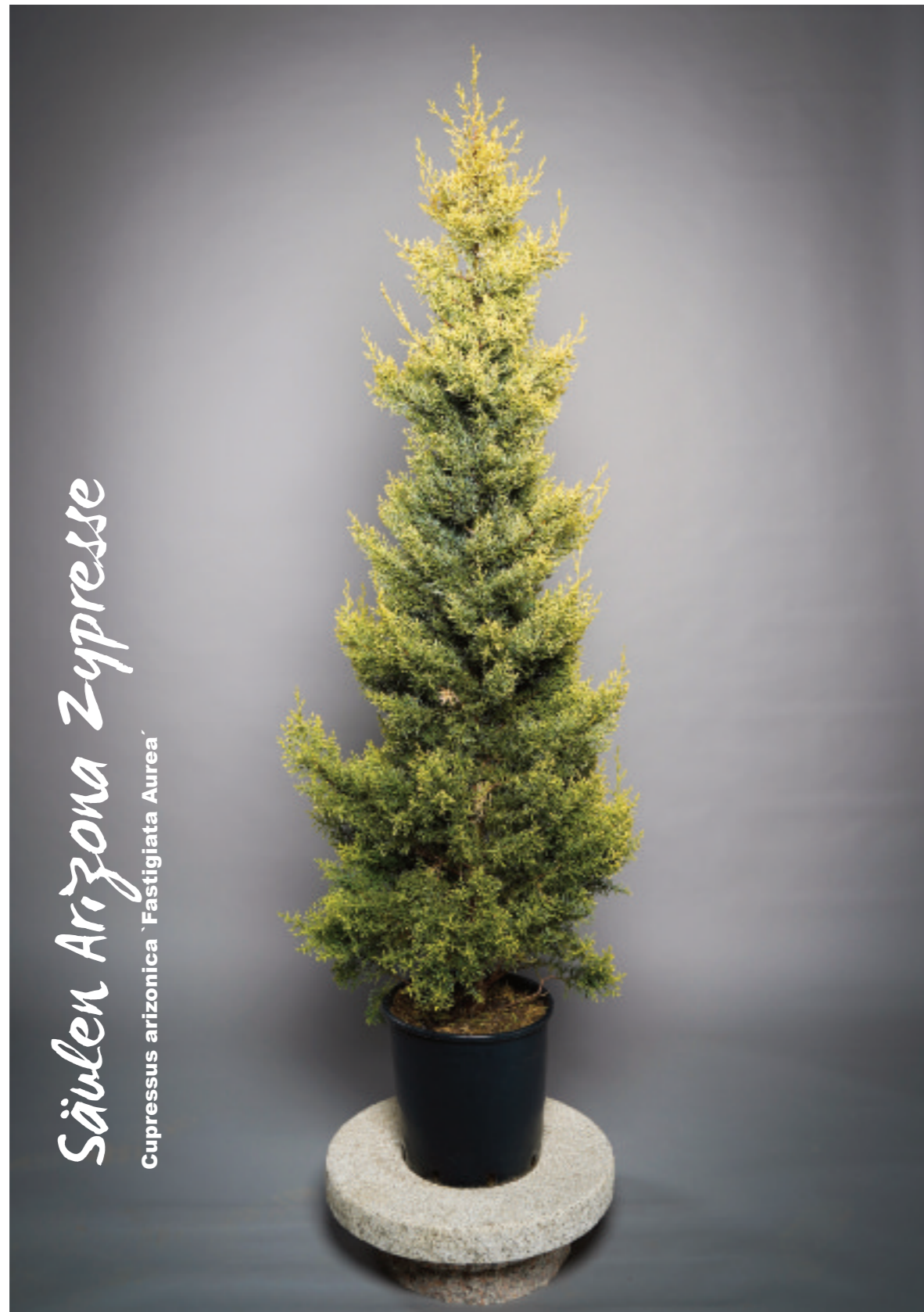
Ihr hellgrünes Nadelkleid entfaltet seine charakteristische Strahlkraft in jedem Fall als Solitär.