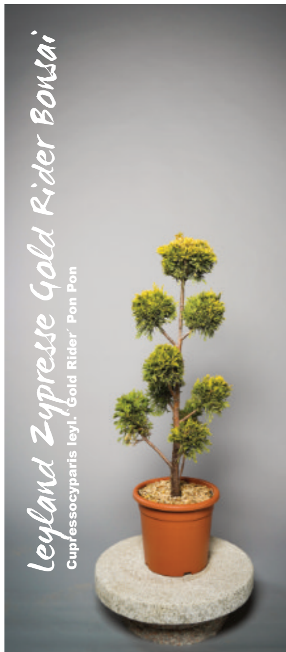
Die zahlreichen Besonderheiten dieser Pflanze, machen sie zur idealen Besetzung eines jeden Gartenkonzeptes.