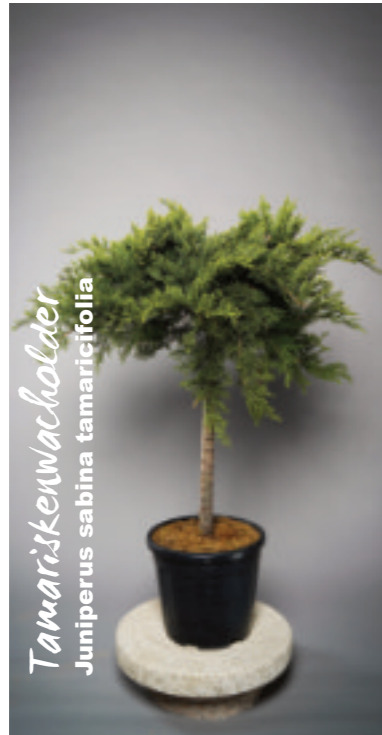
Tamariskenwacholder Juniperus sabina tamaricifolia

Eine perfekte Figur macht er wegen seiner harmonisch fließenden Form in jedem Garten.