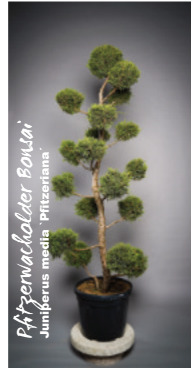
Pfützenwacholder Bonsai Juniperus media 'Pfitzeriana'

Als Highlight in Ihrem Garten zeigt sich das nadelförmige Laub der immergrünen Sorte in einer auffällig blau-grünen Färbung. Die ganz besondere Pflanze im Garten.