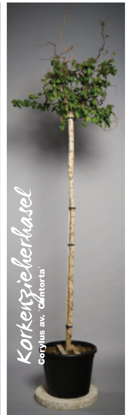
Ihre Triebe sind ein Hingucker da sie wie ein Korkenzieher verdreht sind.