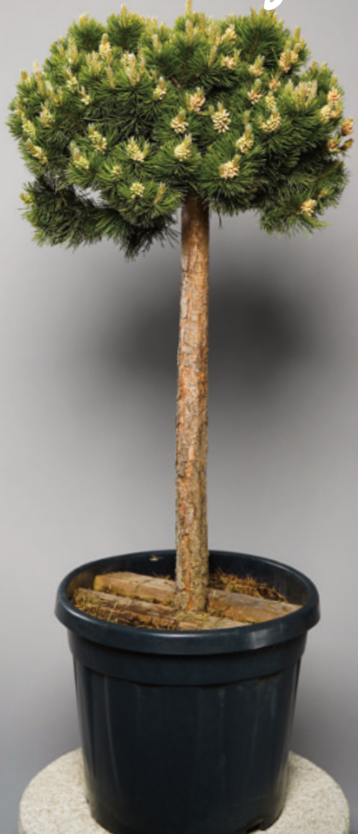
Elegantes Formgehölz mit dunkelgrünen Nadeln.