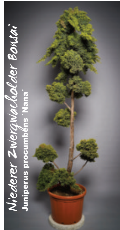
Niederer Zwergwacholder Bonsai Juniperus procumbens 'Nana'

Eine perfekte Figur macht er wegen seiner harmonisch fließenden Form in jedem Garten.